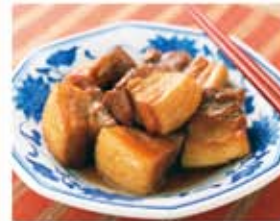
豚の角煮がやわらかく仕上がります。