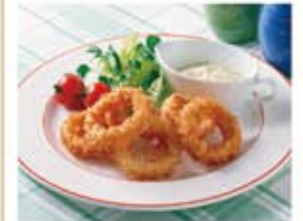
イカは噛みきれるかたさになります。